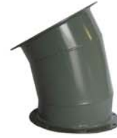
30° - 3 GORE ELBOWS