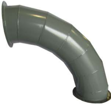
90° - 7 GORE ELBOWS