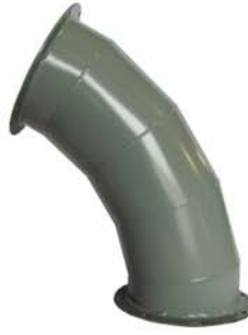
60° - 5 GORE ELBOWS