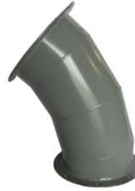
45° - 4 GORE ELBOWS