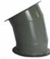
90° - 7 GORE ELBOWS